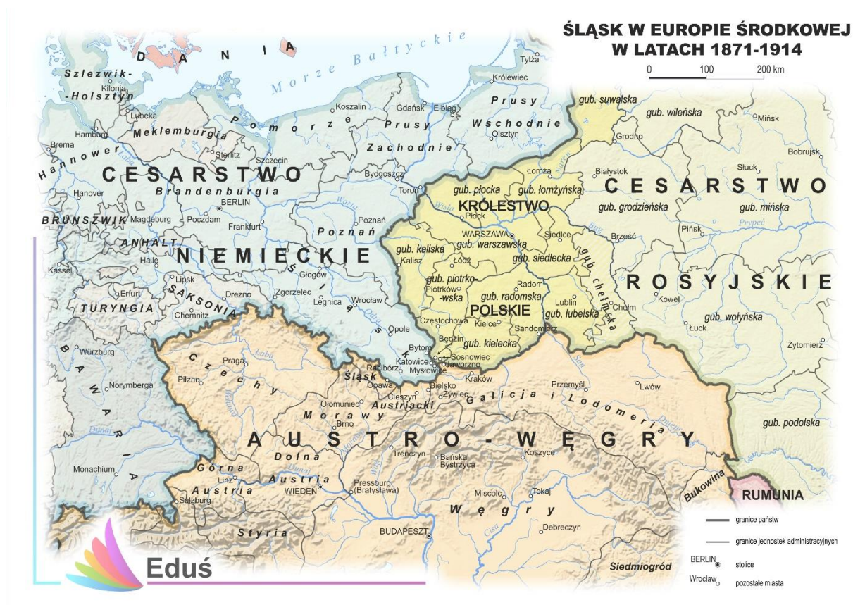
Mapa nr 1. Śląsk w Europie Środkowej w latach 1871-1914

Źródło: http://edus.ibrbs.pl/wp-content/uploads/2017/04/MAP_09_korekta-01-1.jpg